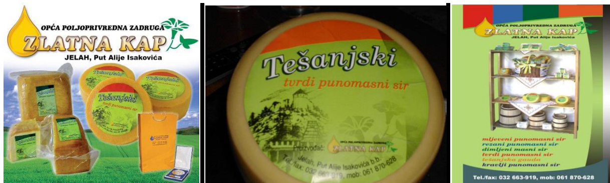
Slika 4. Proizvodni asortiman poljoprivredne zadruge Zlatna kap

Od privrednih subjekata koji u velikoj mjeri zapošljavaju žensku radnu snagu sa ruralnih područja treba istaknuti i firmu Alpina Bromy.