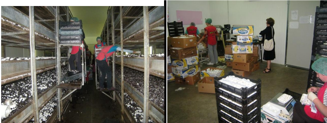
Slika 3. a) BIO-šamp pogon za uzgoj gljiva

Privredno društvo AS d.o.o. Jelah-Tešanj je osnovano 1995. godine. Sjedište društva se nalazi u Jelahu, opština Tešanj, u savremenom poslovnom objektu površine 10000 m 2 , u kome su objedinjeni uprava društva, proizvodnja keksa i veleprodaja. AS trenutno zapošljava preko 369 zaposlenika sa tendencijom upošljavanja mladih visokoobrazovanih kadrova. Već duži niz godina AS postiže veoma značajne poslovne rezultate na području Bosne i Hercegovine. «AS» doo Jelah-Tešanj je od 2008.godine do danas kupovinom što većinskog paketa dionica, što kupovinom udjela organizovalo perspektivnu grupaciju naziva ASGROUP.